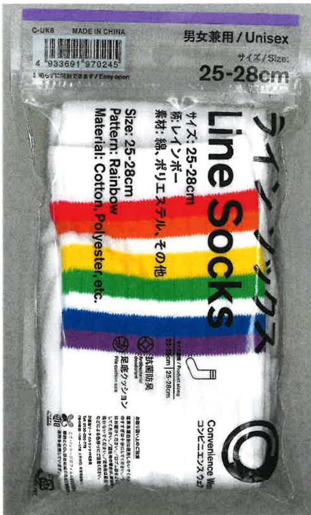
(写真1) 販売袋に入った状態の本件靴下