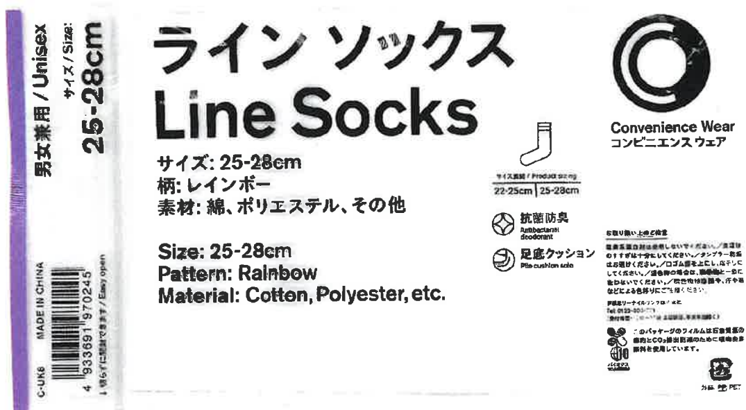
(写真3) 販売袋 (表面)