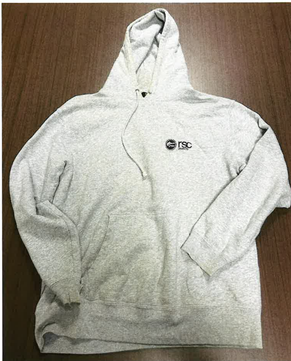
(写真2) 本件パーカー (表面)