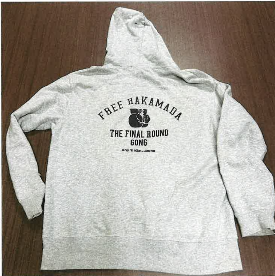
(写真1) 本件パーカー（裏面）