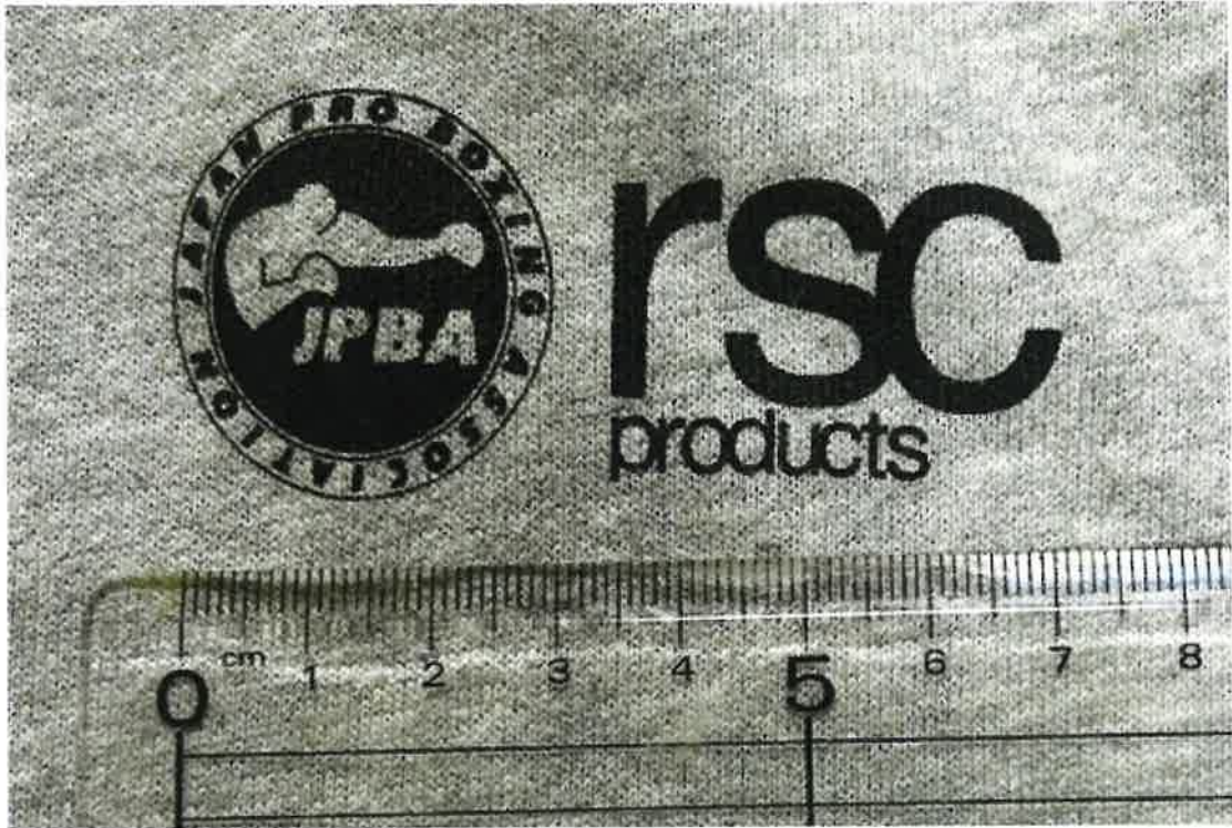
(写真4) 本件パーカー表面の文字・デザイン部分