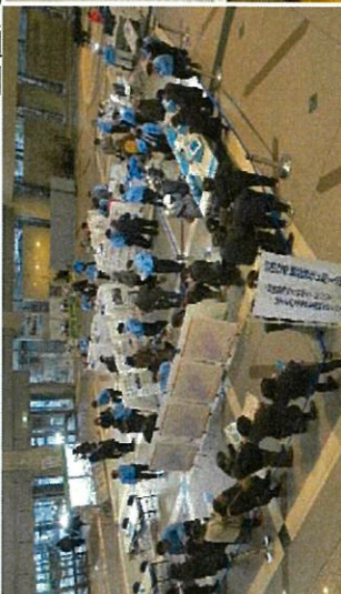
〔練馬区：練馬区役所〕