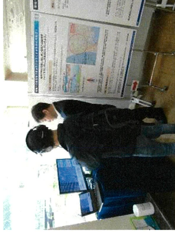
ヘッドフォンを用いた飛行映像コーナー 〈実際に近い形で飛行機の見え方や音を体験〉