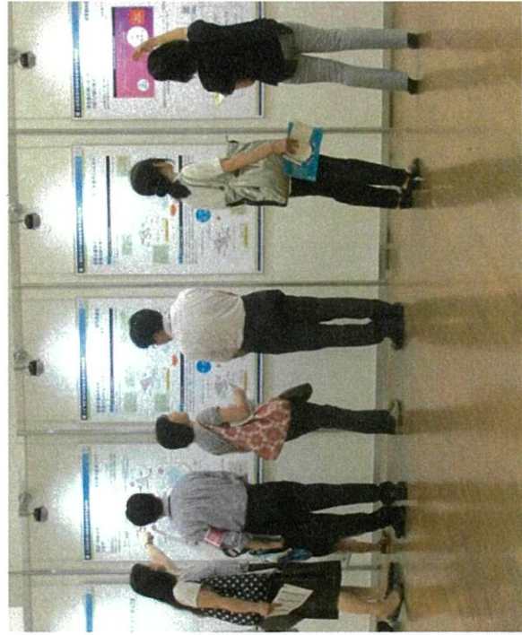
オープンハウス型説明会の様子