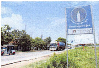
暹羅にたつキヤンドルライト党の看板（15日、カンボジア中部コンボンチャム州で）