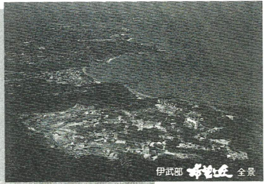
伊武部 希望ヶ丘 全景